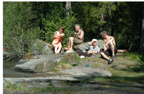
Figur 1: Gezellig aan het water grillen!

Heel Trondheim weet nu dat we een huis aan het zoeken zijn ☺. Na de visning hebben we met de auto rond Jonsvatnet gereden en op een mooi plekje een grill, eten en drinken voor de dag gehaald. Heerlijk in het zonnetje zitten genieten van de rust, de natuur en elkaar.