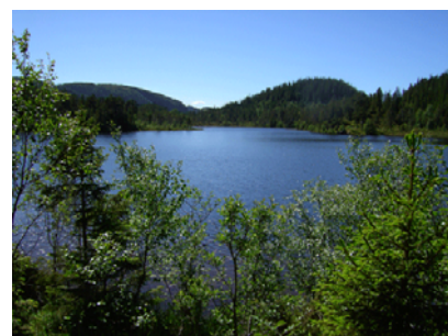
Figur 6: Eh... die andere foto houden we privé :-)