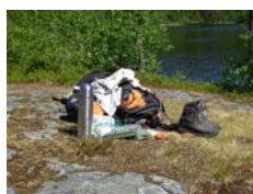
Figur 7: OK, het bewijs...

te baat genomen om verkoeling te zoeken in het water. Er was toch niemand in de buurt die ons kon zien 😊. Na het opdrogen weer aangekleed en op kompas door de rimboe, geheel probleemloos, een ander pad gezocht en gevonden. We worden nog eens echte Noormannen!