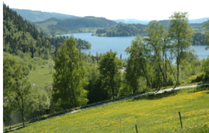
Figur 2: Jonsvatnet vanaf de småbruk