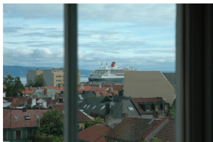
Figur 9: Queen Mary II vanuit de studeerkamer

Afgelopen week is eindelijk onze ADSL-aansluiting gerealiseerd! We hebben nu permanent internet zonder al het moeilijke gedoe van een draadloze verbinding. Het kostte wel een dag om alle kabels goed weg te werken, maar OK 😊.