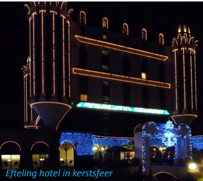
Efteling hotel in kerstsfeer