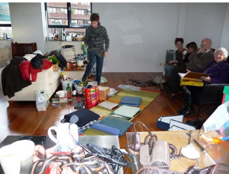
"Niet mee naar Noorwegen"