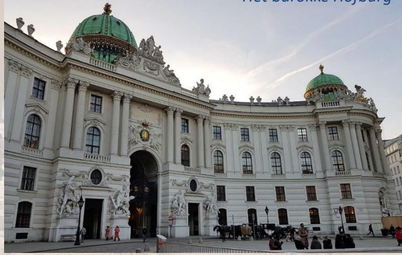
Het barokke Hofburg