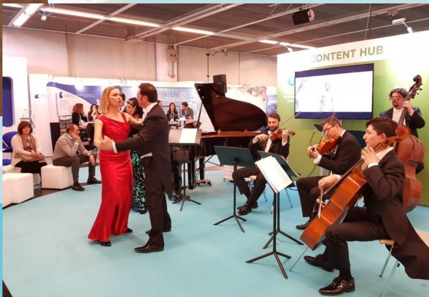
Muzikale omlijsting tijdens de receptie