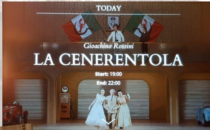
Rossini's moderne Assepoester