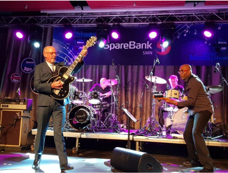
Andy Fairweather Low

Tijdens het Diner Amical werden er twee vrijkaarten verloot voor het Nidaros Blues Festival. Beatrix reageerde zo snel en enthousiast dat ze prompt beide kaartjes kreeg 😊. We hadden een geweldige avond!