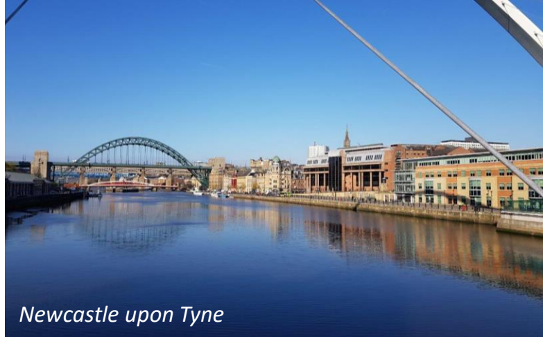
Newcastle upon Tyne