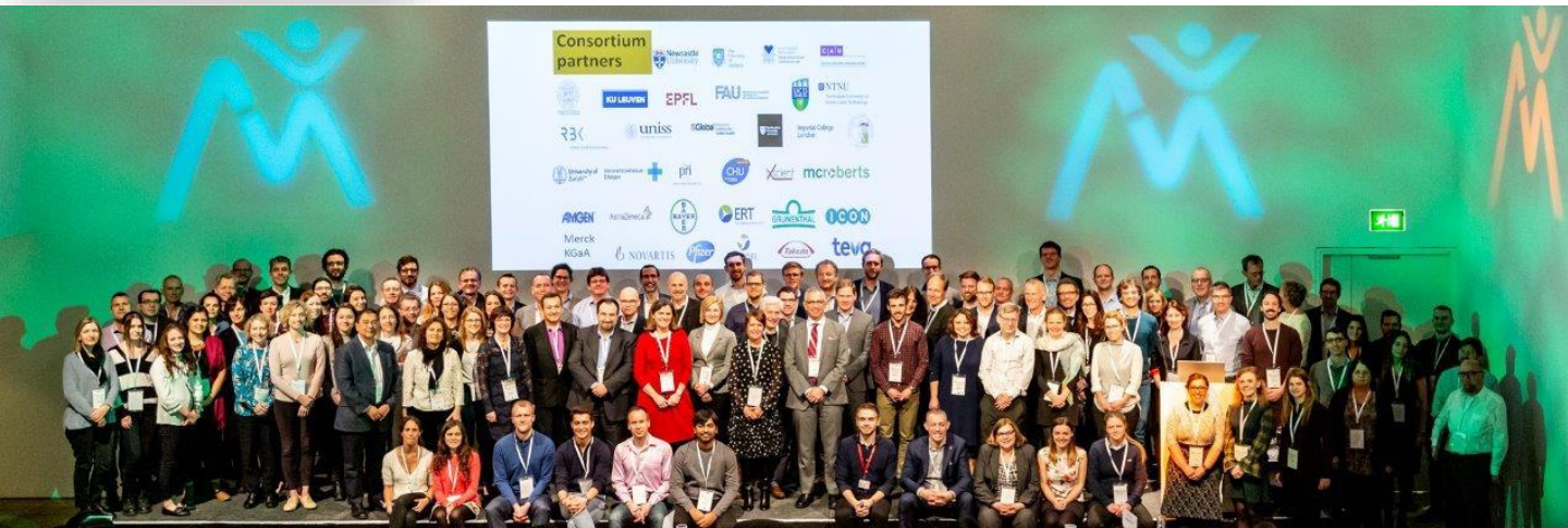
De hele club