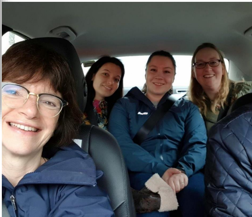
Met zijn allen, plus Newcastle-collega Karen, in de taxi naar het vliegveld