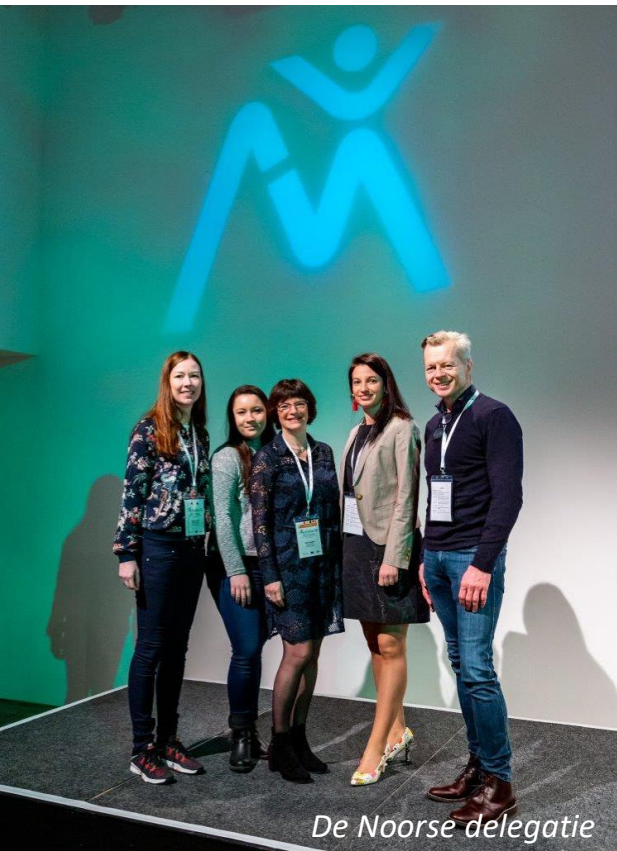
De Noorse delegatie