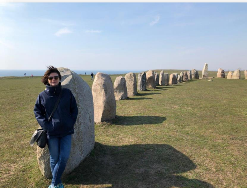
Ales Stenar: het Stonehenge van Zweden