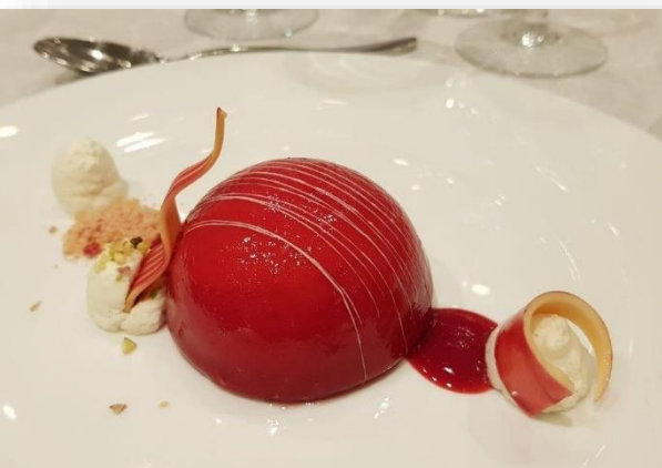
In het land van de chocolade 😊