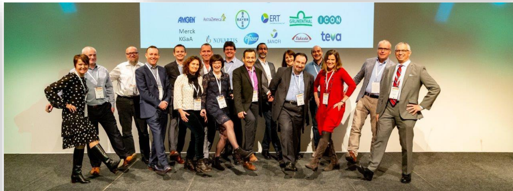
Het management team van Mobilise-D