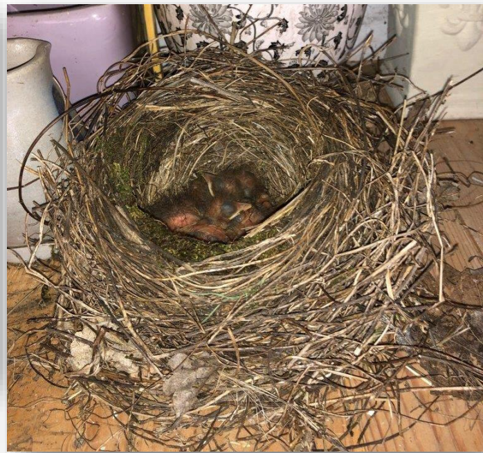
Nieuw merel-leven en een zorgzame moeder