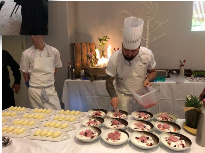
Een welverdiend applaus voor de zwarte en witte brigade

Het eten smaakte niet alleen heerlijk, maar zag er ook erg mooi uit!