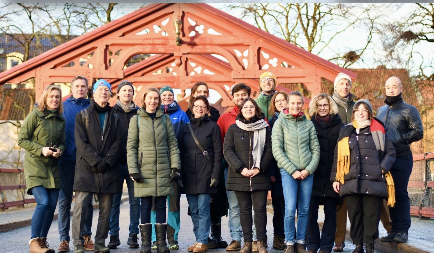
Rondje door Trondheim met de harde kern