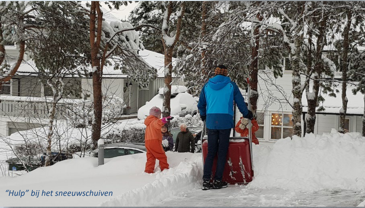
“Hulp” bij het sneeuwschuiven