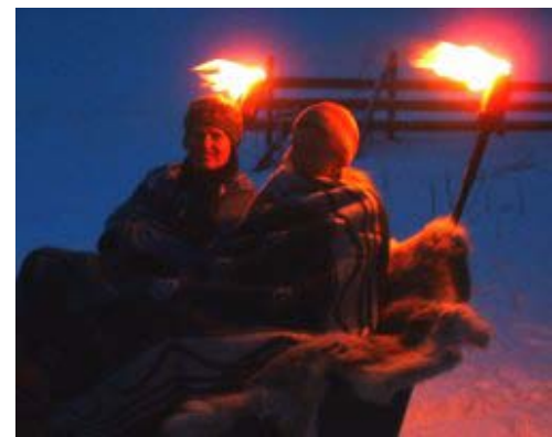
"Hesteskys" naar Lian