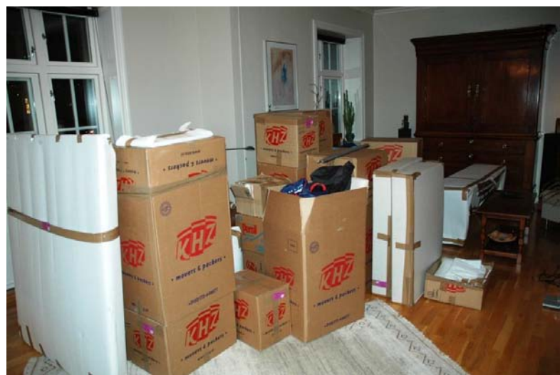
Oeps... dit is pas de eerste helft!

Dinsdag 9 december stond er een verhuswagen voor de deur bij “De Herder”, en op 22 december is alles keurig afgeleverd in Trondheim.