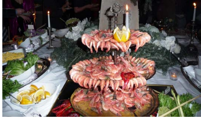
Visgerechten in het Britannia hotel

Een van de belangrijkste is het "Julebord": de kerstmaaltijd met collega's, de sportclub, de vereniging etc. Een avondvullend programma met traditioneel Noors voedsel, veel toespraken en dans tot slot.