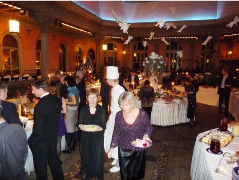
Julebord in het Britannia hotel