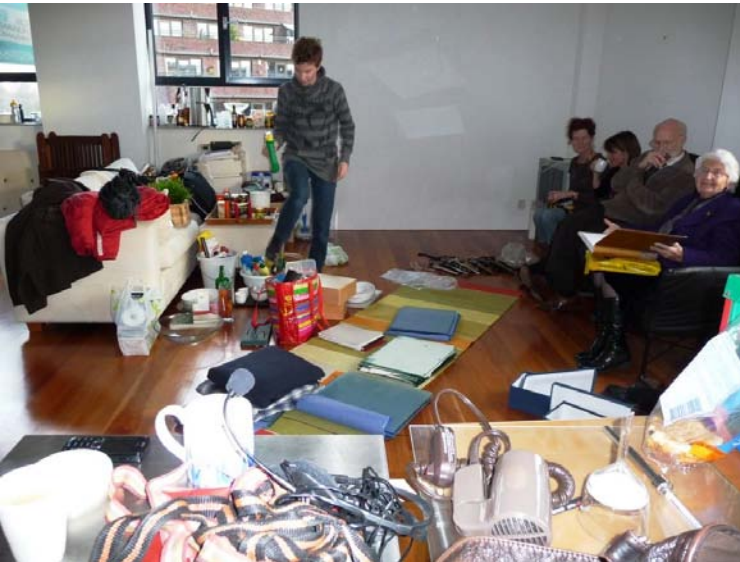
“Niet mee naar Noorwegen”