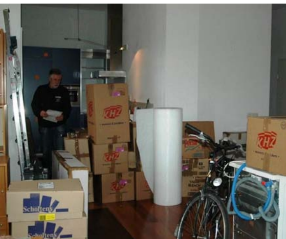
De verhuizers aan het werk

Dinsdag 9 december stond er een verhuswagen voor de deur bij “De Herder”, en op 22 december is alles keurig afgeleverd in Trondheim.