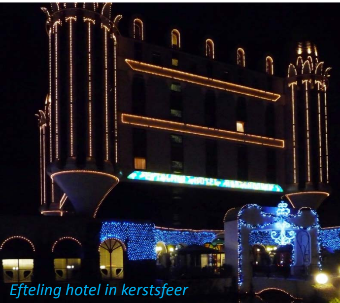
Efteling hotel in kerstsfeer