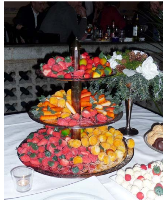
Een klein deel van het nagerecht