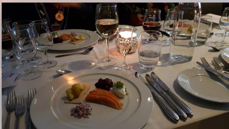
Klassieke combinatie: akevitt bij rakfisk, oftewel gefermenteerde vis