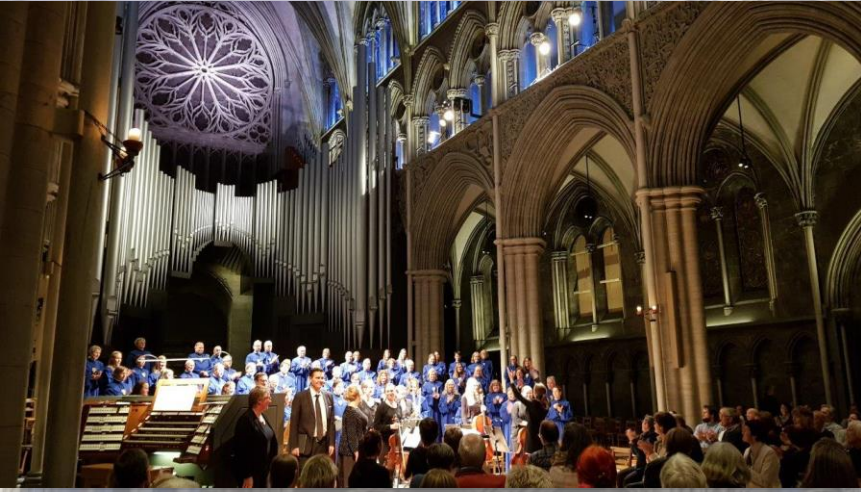
Zowel het dom-koor als het oratorium-koor deden mee