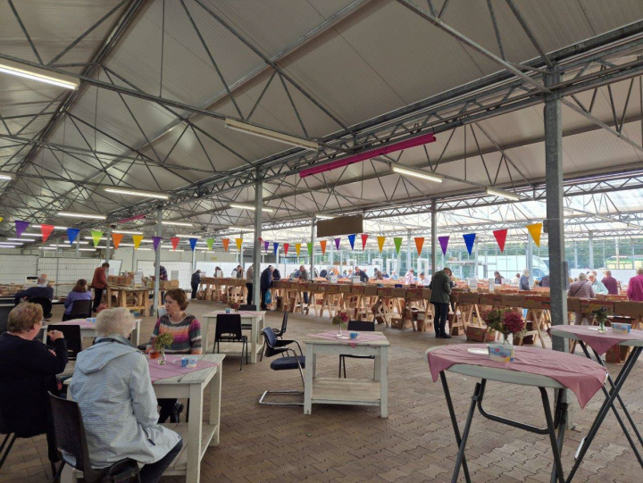
Samen naar de boekenbeurs: Bea in de koffiehoeke, 's mam als gezelschapsdame