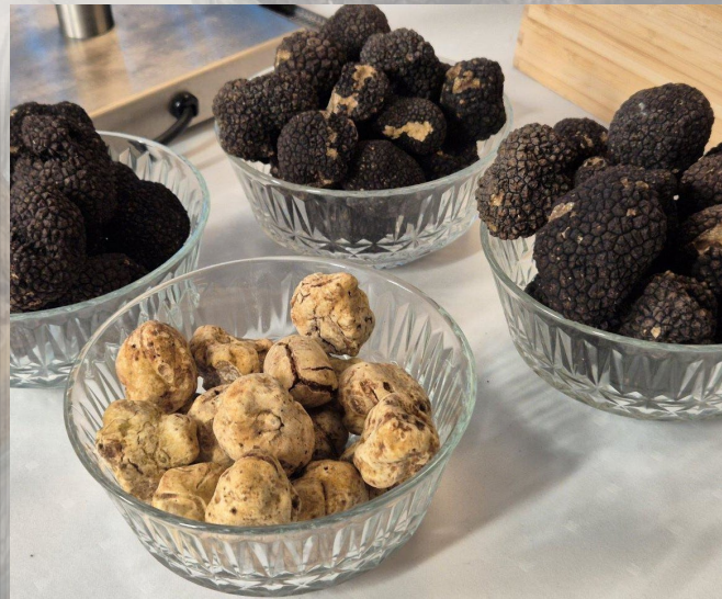
We kregen zowel zwarte als witte truffel