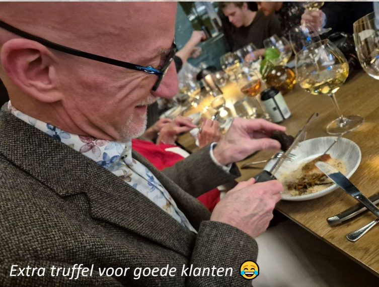
Extra truffel voor goede klanten 😊