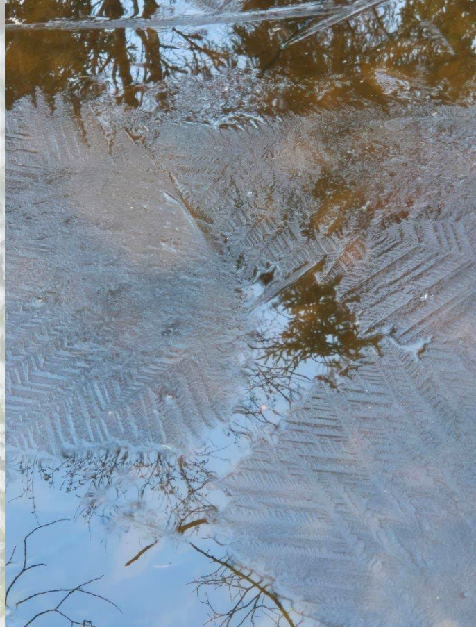
Ijsbloemen op de kikkervijver achter ons huis