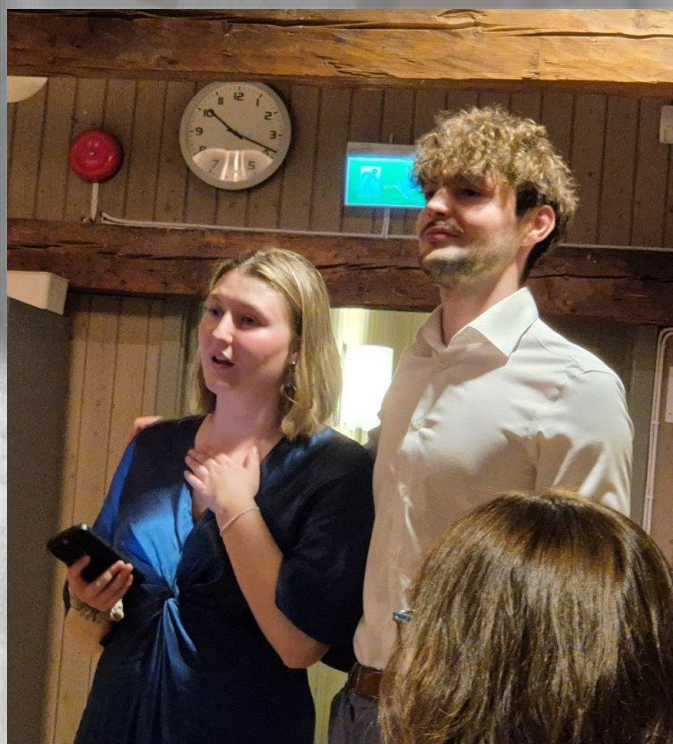
Ontroerende speech van Anne's kinderen