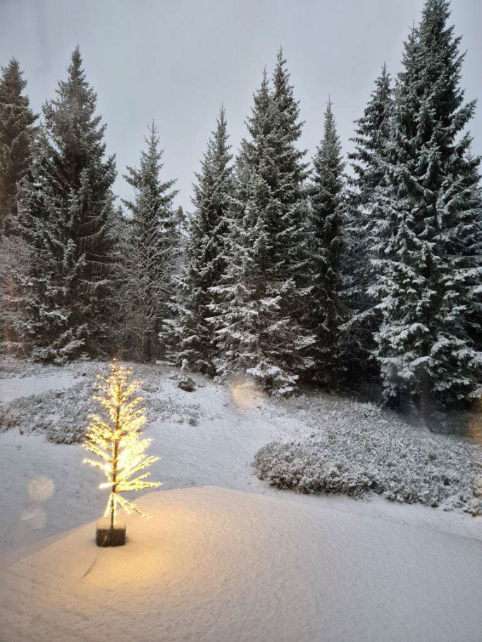
Bij ons nog heel bescheiden ...